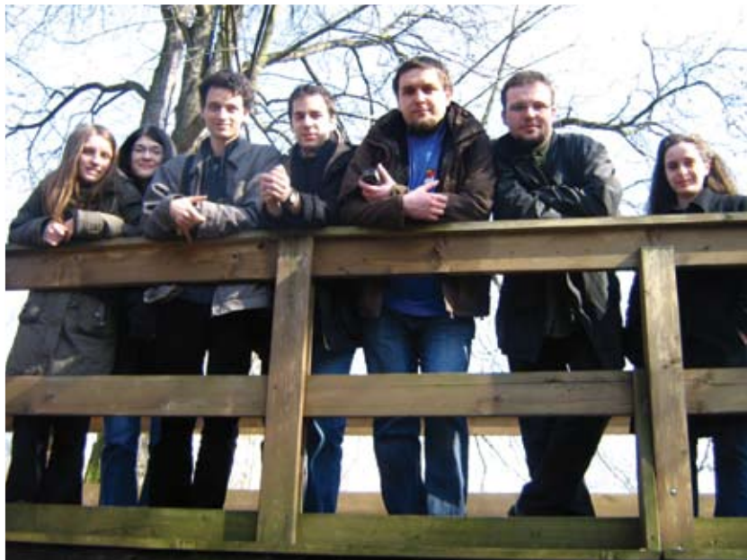
Európai Magyar Evangéliumi Ifjúsági Konferencia, Burbach/Holzhausen (Németország) 2008.március.15-21