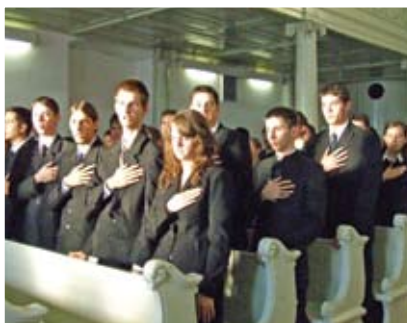
Az elsőévesek fogadalomtétele