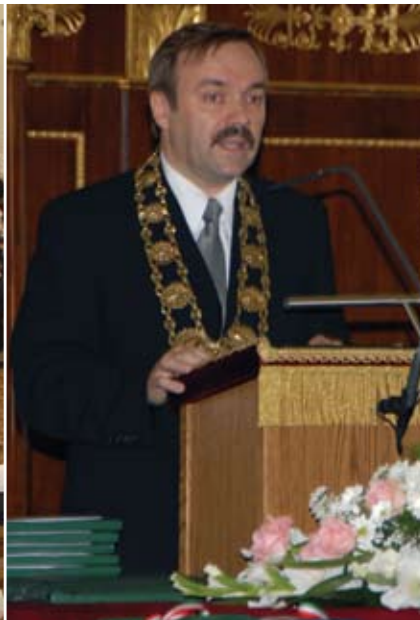
Évzáró istentisztelet és diplomaosztó ünnepi szenátusülés a Nagytemplomban