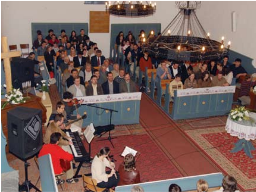
Évkezdő csendesnapok Ramocsaházán, a közösségépítés jegyében